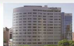
済生会福岡総合病院