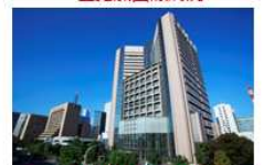
国立がん研究センター中央病院